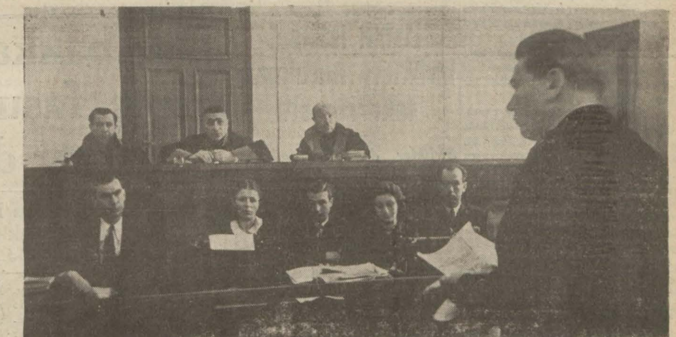
Pavlof heyeti hâkime huzurunda beyanatta bulunuyor